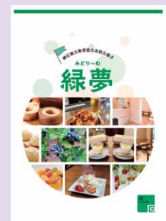
③ 緑区魅力発信協力店 「緑夢(みどり〜む)」