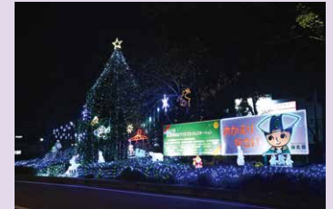
② 東浦和駅前 クリスマスイルミネーション