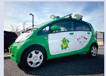
③青色防犯パトロール