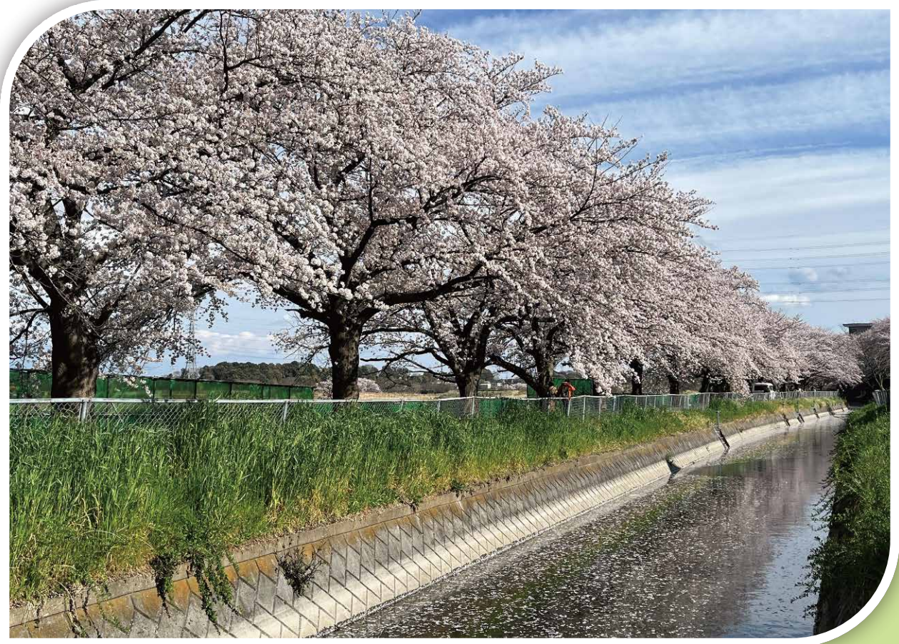
桜の下を散策できる日本一の桜回廊（見沼代用水西縁）