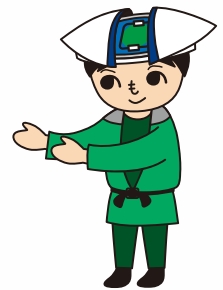
緑区マスコットキャラクター