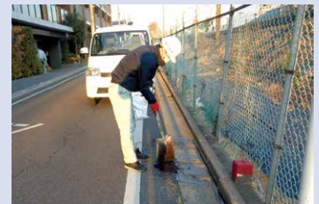
②道路安全パトロール