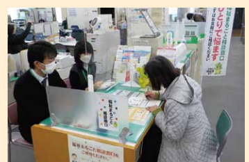
⑤ 福祉まるごと相談窓口