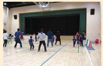
③ 生活習慣病予防普及啓発