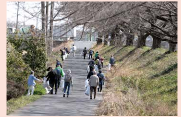
② 緑区見沼田んぼ キレイきれい大作戦