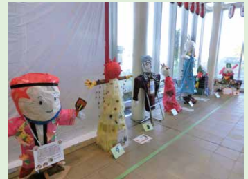
② 緑区かかしランド