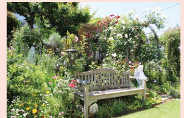
③ 緑区オープンガーデン