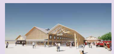
⑦ 農業交流施設(イメージ)